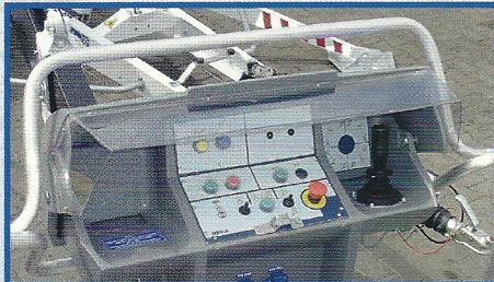
Arbeitskorb mit Werkzeugablage – serienmäßig außer DINO 105TL/120T